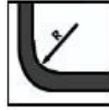
Bükülme Faktörü 5* (D)